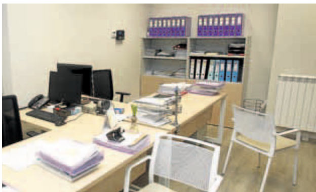
las obras. Sobre estas líneas, detalle de un despacho.